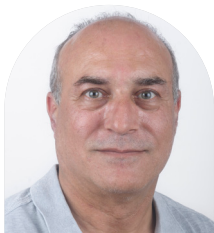
SAINT-CREPIN-AUX-BOIS Laurent BARGADA