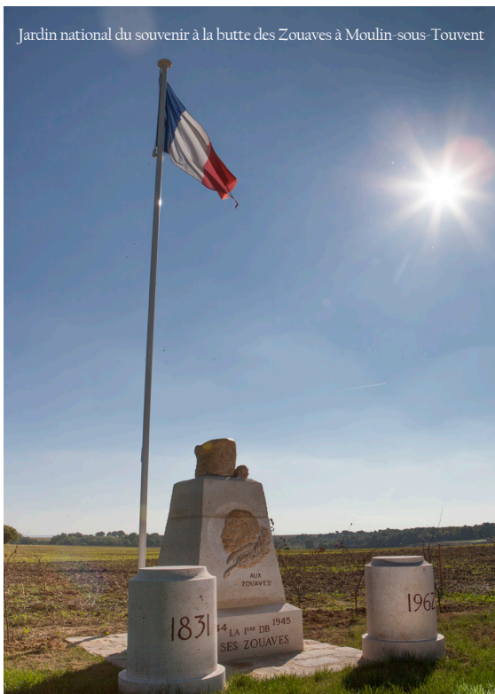
Jardin national du souvenir à la butte des Zouaves à Moulin-sous-Touvent

En 1914, aussitôt constitués, le 1 er Bataillon de l'active et le 11 e Bataillon formé par des éléments de réserve partent d'Oran sous le commandement du